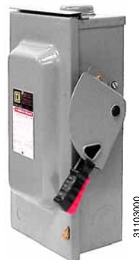
Figure / Figura / Figure 1 : Switch in the OFF (O) Position / Interruptor en la posición de abierto (O) / Interrupteur en position d'arrêt (O)